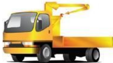
Ανοικτό με γερανό