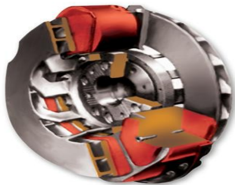
Σχήμα 2.24 Ηλεκτρομαγνητικός Επιβραδυντής